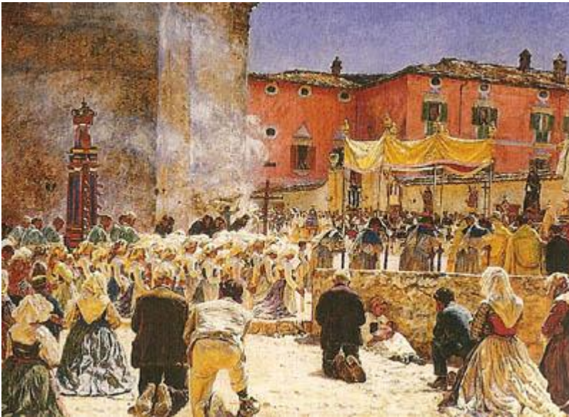
Kristian Zahrtmann, Processione di San Lidano