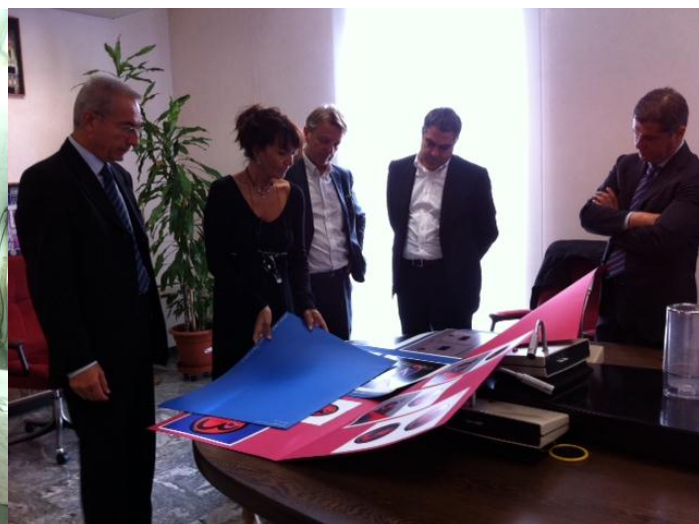
Una versione della “Blowcar” in corso di allestimento